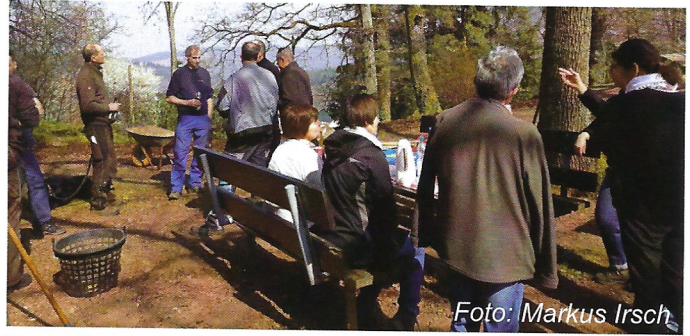
Gemütlicher Ausklang nach getaner Arbeit