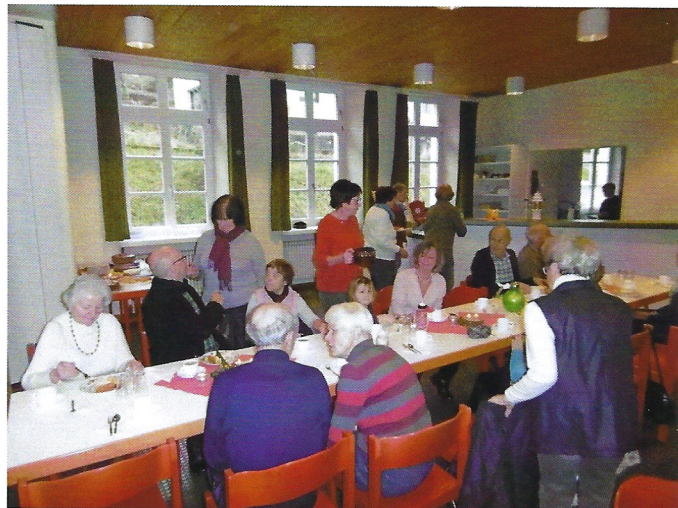
Offener Treff am Rosenmontag