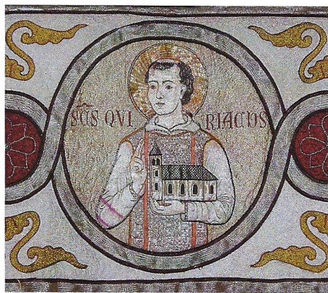
Darstellung Hl. Quiriakus

1250 Jahre Hl. Quiriakus in Taben-Rodt 1250 Jahre sind seit der Übertragung der Reliquien des Hl. Quiriakus von St. Maximin in Trier nach Taben-Rodt an der Saar vergangen. Wir in Taben-Rodt halten sein Andenken lebendig. Im Jahre 769 erfolgte die Überführung der Gebeine des Hl. Quiriakus von der Abtei St. Maximin in Trier nach Taben. Das Gebiet von Taben hatte Frankenkönig Pippin der Kleine, als Dank für die Heilung seines Enkels, 768 der Abtei St. Maximin geschenkt. Mit der Überführung der Gebeine