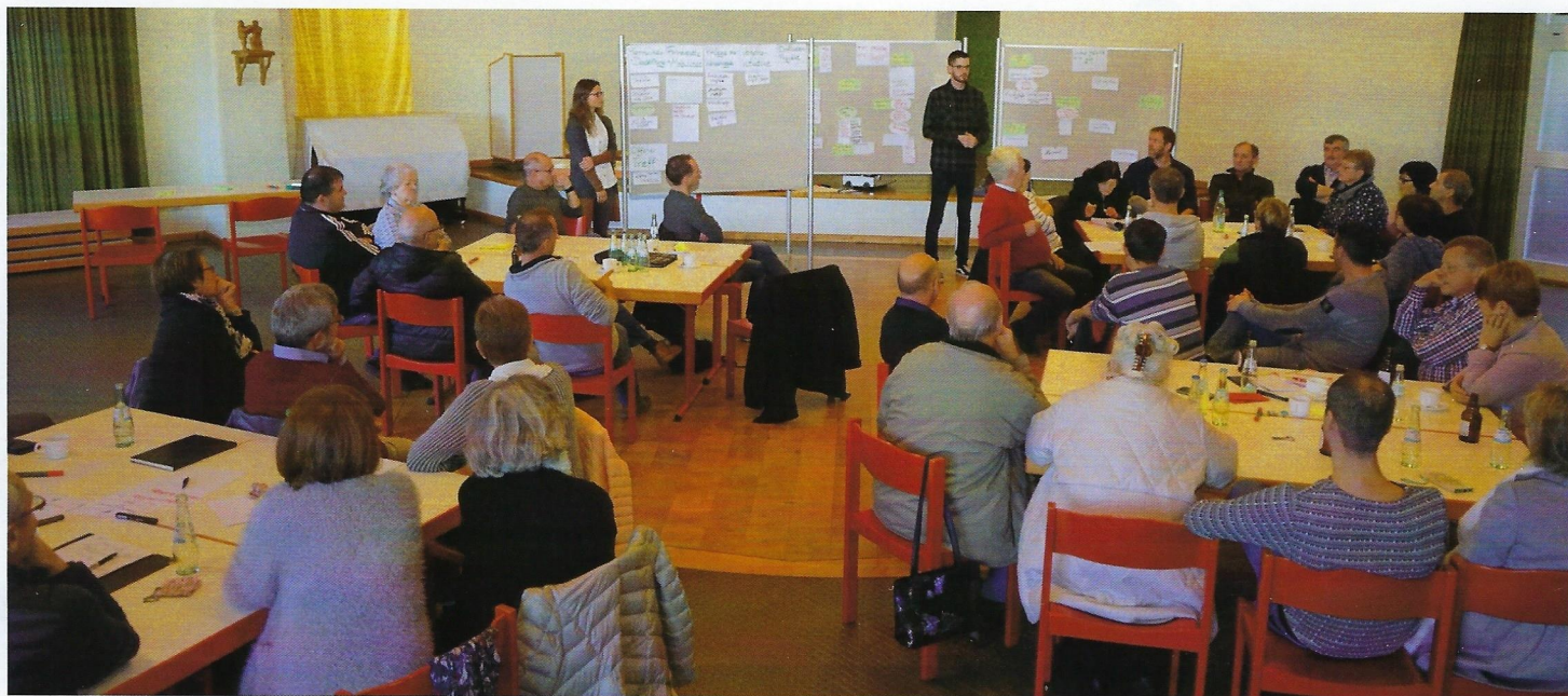
Die aktive Teilnahme der Tabener zeugt vom hohen Interesse an der Bürgerwerkstatt im Bürgerhaus.

gebildet, die sich mit folgenden Themenbereichen beschäftigen werden: Etablierung eines Dorfladens, Pflege der Wanderwege, Fahrdienst/Mobilität, Offener Treff und Verkehr/Infrastruktur. Die hier vorliegende Dorfzeitung „Towener Blaad“ soll dabei das Bindeglied zwischen den einzelnen Gruppen sein. Das „Towener Blaad“ will die Arbeit der einzelnen